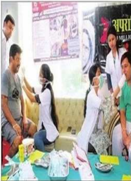
राजनगर एक्सपोजिशन में दांतों की जांच कराते लोग।